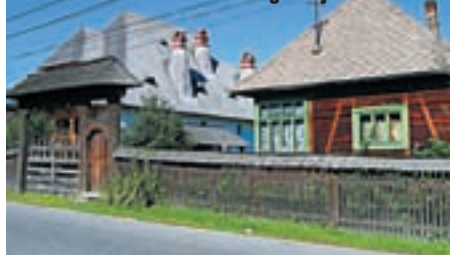
Maramures - tradicionalna gradnja

Svaki dan ovdje donosi nešto novo. Nova iskustva, nove susrete, nove krajolike i sve vas skupa čini jačim, sretnijim, zadovoljnijim, ispunjenijim. To je to, vožnja i život na dva kotača. Zavojite ceste što se čas uspinju, čas spuštaju ovim bregovima i udolinama što pršte od ljepote zelenila i ova mnogobrojna zaprežna kola koja za razliku od automobila ne narušavaju