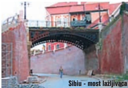
Sibiu - most lažljivaca