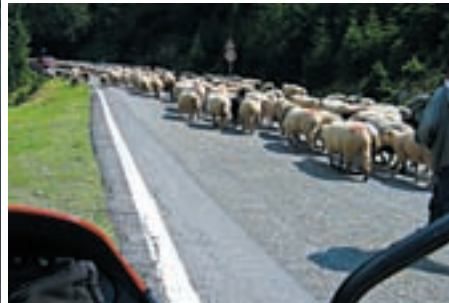
Glacijalno jezero pri vrhu Transilvanijskih Alpi

odmicalo, moje su tegobe prestajale i ponovno sam bio onaj pravi, spreman na sve. Šumovite predjele postupno su zamjenjivala zelena, gola, blago izvaljana brda, te mnogobrojna slikovita jezera i sela.