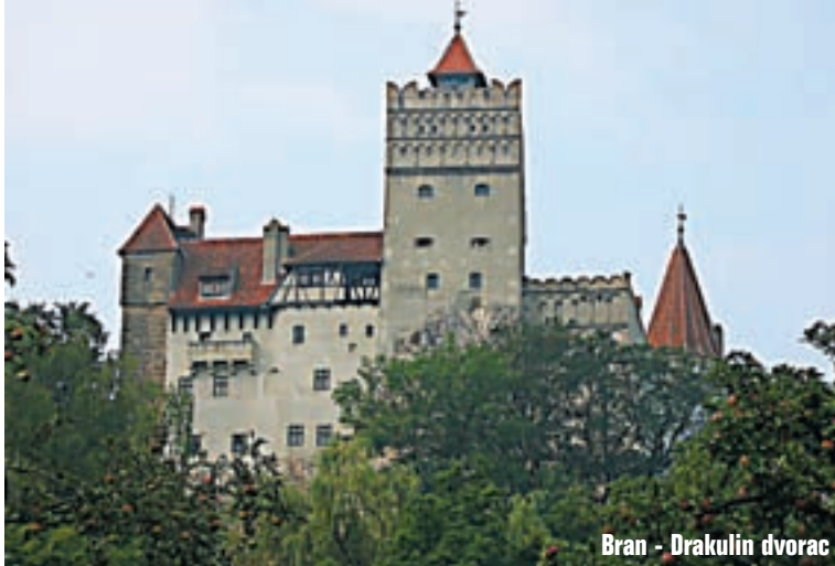
Bran - Drakulin dvorac