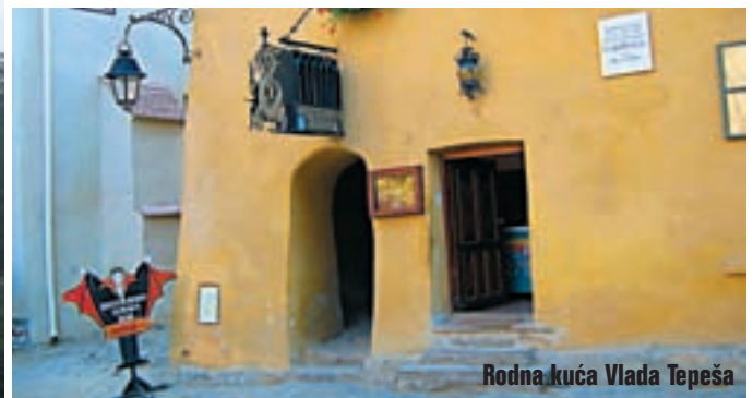
Rodna kuća Vlada Tepeša