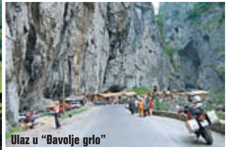
Ulaz u "Đavolje grlo"