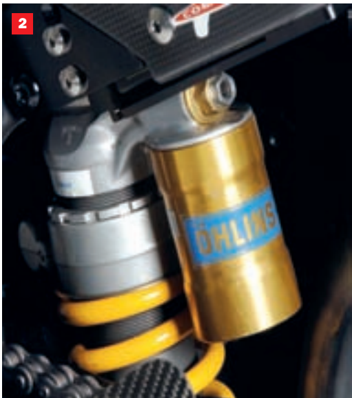
1. Prednja Ohlinsova TTX vilica i olakšani Machesini naplatci. Snažna kočiona klijesta tvrtke Brembo u kombinaciji s nazubljenim diskovima. 2. Stražnji Ohlinsov amortizer, mekši za ovu godinu, brine se za poboljšanje hvatljivosti stražnje gume. 3. Amortizer upravljača smješten ispod oplata