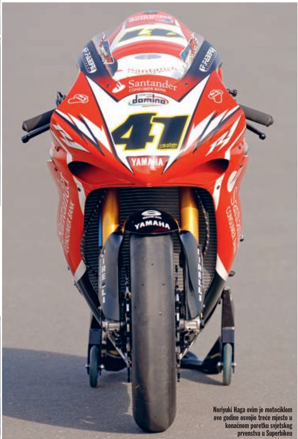
Noriyuki Haga ovim je motociklom ove godine osvojio treće mjesto u konačnom poretku svjetskog prvenstva u Superbikeu

iz zadnjeg zavoja prije ciljne ravnine, jer ćemo napokon osjetiti što znači imati preko 200 KS na kotaču. Još u nagibu otvaramo gas postupno do kraja i osjećamo kako prednji kotač "lebdi", a volan nam "ostaje u rukama", na što motocikl reagira jedva zamjetnim "plesanjem". Prebacujemo u četvrtu, već smo izravnati. Motocikl ne može biti mirniji, a osjećaj ubrzanja je još bolji nego u trećoj brzini. Intenzitet ubrzanja se ne smanjuje niti u petoj i šestoj brzini. Telemetrija kasnije pokazuje brzinu veću od 290 km/h, što i ne bi bio neki podatak da se ne radi o ravnici dugoj 1.100 metara. Neopisiv osjećaj, ali nemamo puno vremena za razmišljanje jer dolazimo na "slijepo kočenje", što bi značilo da se zavoj ne vidi onda kada se počinje kočiti. Prejak početni stisak uznemiruje motocikl, a mi se nepripremljeni nabijamo na spremnik goriva. Srećom, kočili smo prerano, pa se bez problema namještamo za ulazak u zavoj. Ulazak u za-