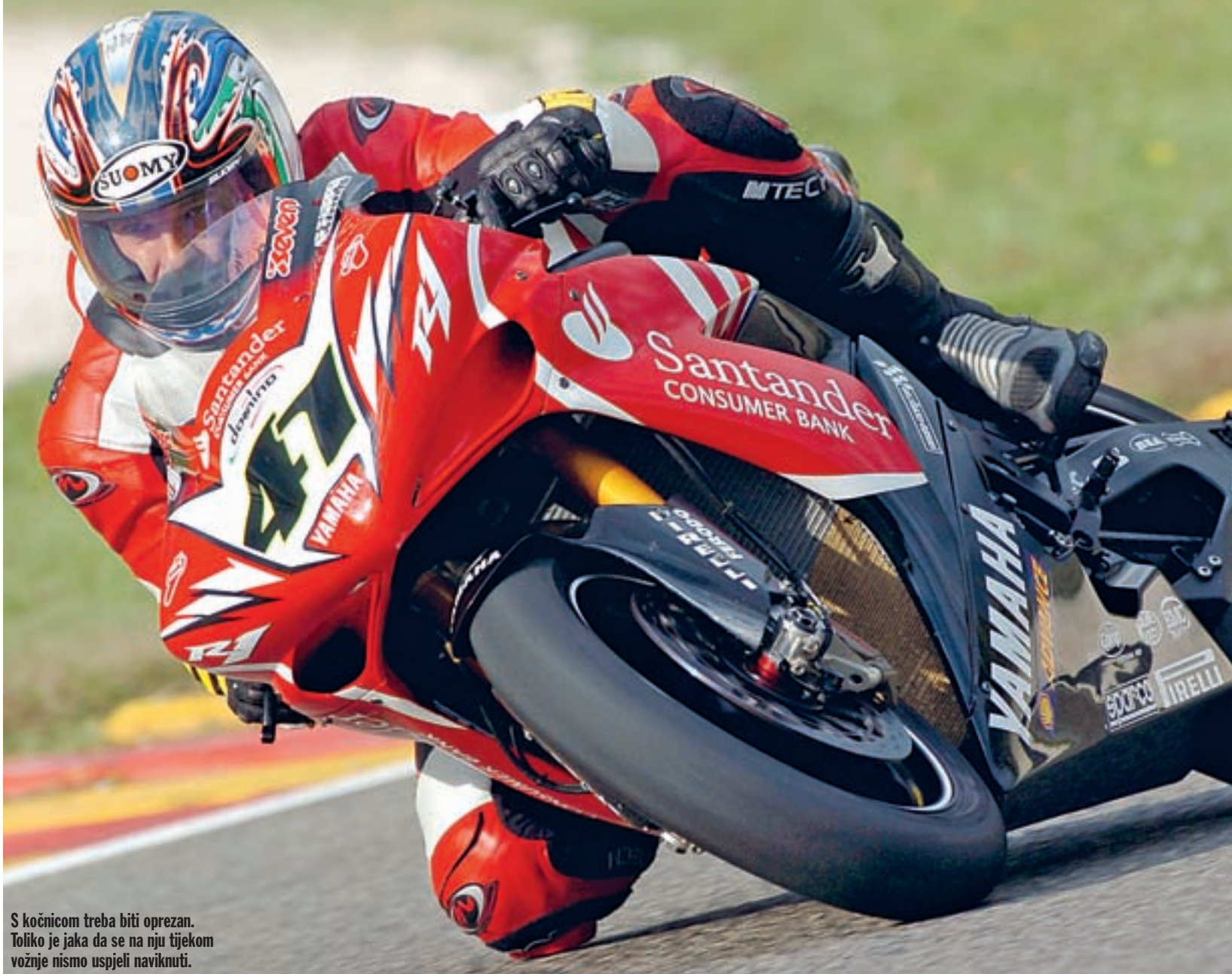
S kočnicom treba biti oprezan. Toliko je jaka da se na nju tijekom vožnje nismo uspjeli naviknuti.

voj nije toliko lagan, koliko je precizan. Zamišljenju putanju se prati bez problema, čak kada se čini da ste pretjerali s brzinom. Otvaranje i izlaz iz zavoja je uz kočnicu najfascinantniji. Čini nam se da tu elektronika igra najvažniju ulogu, jer koliko god gasa dali, motocikl se ne diže na zadnji kotač i ne dolazi do njegovog proklizavanja. Pošto znamo da se to događa kod puno slabijih motocikala, očigledno je da sustav protiv proklizavanja ne dopušta nikakve nepredvidive reakcije. Sada znamo o čemu je Haga govorio i zašto mu je dosadno. Pretpostavljamo da elektronika punu snagu otpušta tek u četvrtoj brzini, što objašnjava osjećaj