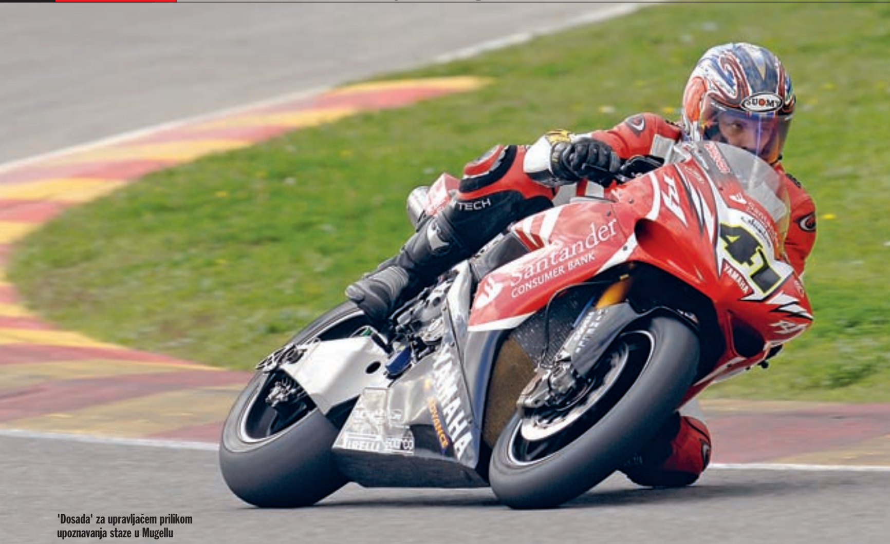
'Dosada' za upravljačem prilikom upoznavanja staze u Mugellu