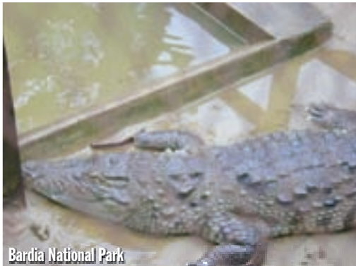
Bardia National Park