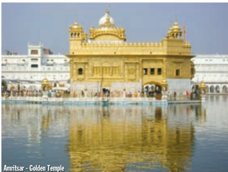
Amritsar - Golden Temple