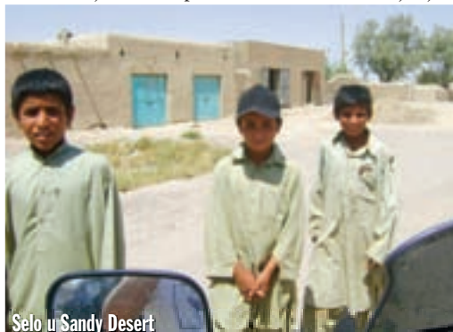
Selo u Sandy Desert