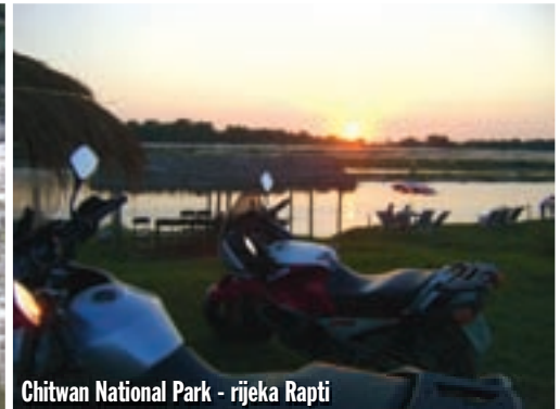
Chitwan National Park - rijeka Rapti