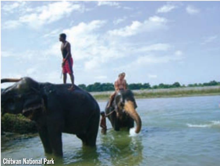
Chitwan National Park