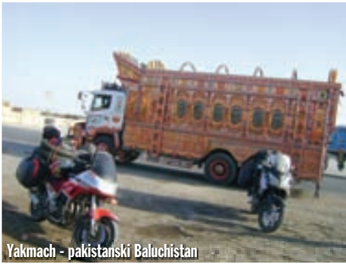
Yakmach - pakistanski Baluchistan