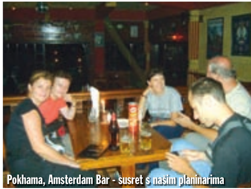
Pokhama, Amsterdam Bar - susret s našim planinarima