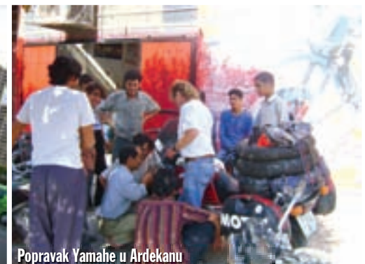
Popravak Yamaha u Ardekanu