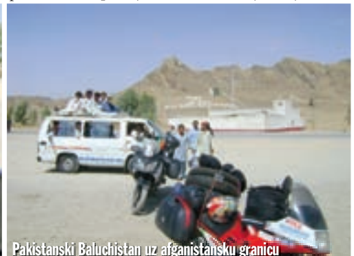
Pakistanski Baluchistan uz afganistansku granicu