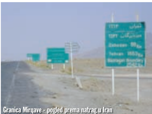
Granica Mirqave - pogled prema natrag u Iran