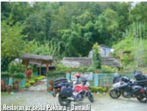
Restoran uz cestu Pokhara - Damauli

u kamenu ogradu, odbila se od nje i krenula preko ceste direktno u mene. Nekada sam povremeno znao igrati bilijar, te sam u trenutku izračunao da će udariti u ogradu, pored koje sam ja sjedio na motoru, neposredno prije mene, da će se odbiti od nje i neće me niti taknuti. Nisam imao vremena skočiti s motora niti učiniti bilo što drugo, mogao sam samo čekati što će se dogoditi. Proračun je skoro bio točan. Cisterna je udarila u ogradu metar prije mene, odbila se i prošla pored motora i mene na samo nekoliko centimetara. Ipak je udarila u desni kofer i otrgla ga. Pritom je i destabilizirala i mene na motoru, pa sam se prevrnuo na lijevu stranu i ostao naslonjen na ogradu. Cisterna je nastavila svoj rušilački put prema sredini ceste, prema dijelu gdje potok teče preko nje. U tu udubinu doletjela je već poprečno i udarivši punom snagom odbila se na lijevu bankinu i prevrнула se. A samo nekoliko metara