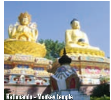
Kathmandu - Monkey temple