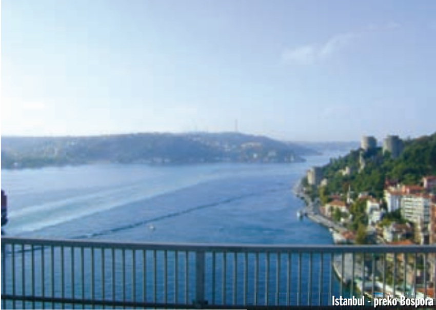
Istanbul - preko Bospora