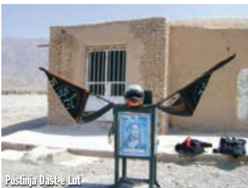
Pustinja Dašt-e Lut