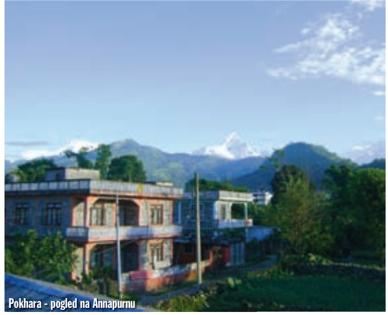
Pokhara - pogled na Annapurnu

onu rijeku isto tako nije problem, pa smo se uskoro našli na asfaltu. Glavna cesta južnim Nepalom solidna je, ali su je obilne kiše na nekoliko mjesta uništile, pa nam je trebalo malo akrobacija da je prijedemo. Do mraka smo prošli 310 kilometara i skrasili se u hotelu Rajdoot u Butwalu. Sljedeći dan na rasporedu je možda najljepša cesta u Nepal, ona koja kroz gorje Mahabharat Range vodi u Himalayu, u grad Pokharu. Ujutro smo najprije morali čekati 2 sata da očiste odron koji sam prošao teško, kroz žitko blato, sa priličnom dozom straha. Ispod mene provalija je bila duboka više stotina metara. Cestu uz rijeku Andhi Khola opisao sam prošle godine, pa neću ponavljati - ostala je ista, baš kao i Pokhara i moj prošlogodišnji pansion Holy Lodge. I cijena je ista, dvokrevetna soba stoji 4 eura za noć.