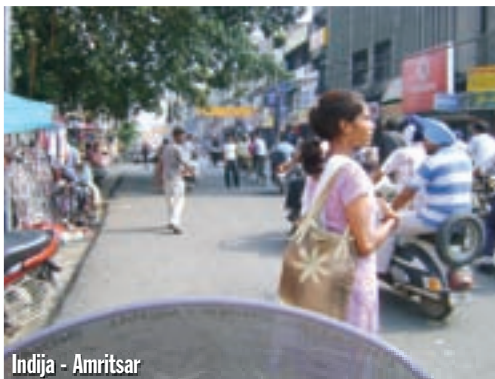
Indija - Amritsar