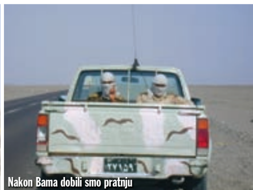
Nakon Bama dobili smo pratnju