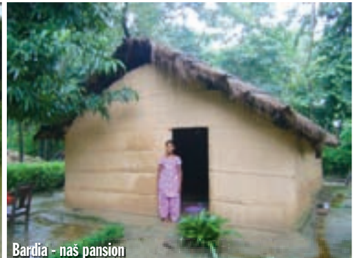
Bardia - naš pansion