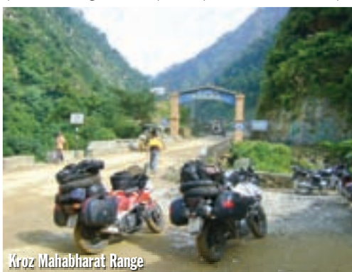
Kroz Mahabharat Range