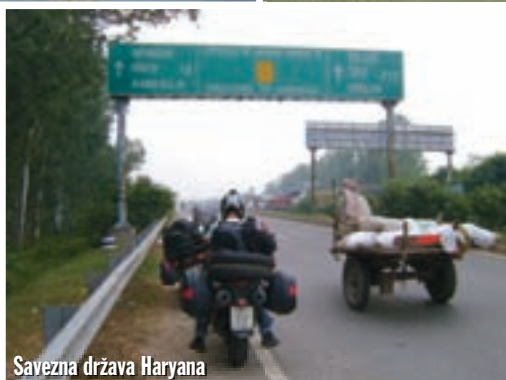
Savezna država Haryana