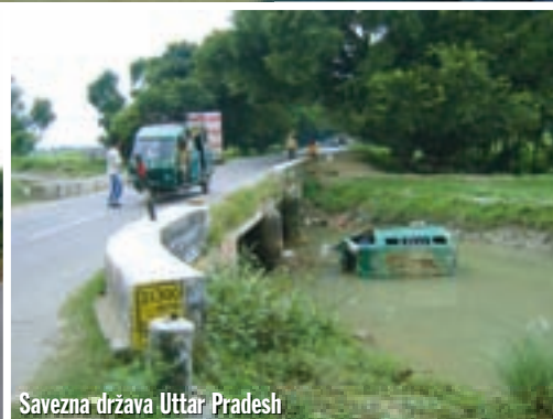
Savezna država Uttar Pradesh

i barom, a motore smo ostavili vani uz uvjeravanje osoblja da su na sigurnom. Danas smo prošli samo 180 kilometara – s granice smo krenuli tek poslijepodne, a nekoliko sati smo se zadržali u Golden Templu.