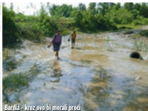
Bardia - kroz ovo bi morali proći

drveća, a domaći momci skaču u vodu i izvlače drva, potrebna su im za ogrijev. Koje li hrabrosti (ili ludosti), koliko smo samo krokodila vidjeli u rijeci? Ali, kada smo ujutro gazili kroz poplavu i bili u vodi preko pojasa, bili smo u toj istoj rijeci! Hm, na to onda nismo mislili.