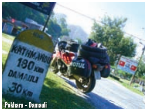
Pokhara - Damauli

Novo je jedino što me ove godine nitko nije pokušao opljačkati. Isti je ostao i Amsterdam-bar i osoblje u njemu. Također i uvijek odlična muzika u baru, stoga i atmosfera. A isto je ostalo i to da se ovdje sve zatvara u 10 navečer. Policija provodi strogu kontrolu. Iako Nepal u međuvremenu nije kraljevina, komunisti su zadržali taj nepopularan zakon. Ali su komunisti omogućili da možemo normalno kupiti benzin. Za 1 euro dobije se 100 ovdašnjih rupija, a isto toliko stoji i litra benzina. Isti je ostao i Sunny motorbike repairing centre, gdje sam prošle godine nabavljao benzin. Sada ih trebam da napravimo servis na motorima. Prošli smo od kuće 9.500 kilometara. Naravno, servis ćemo raditi sami, ali uvijek nađem servis da mogu zbrinuti staro ulje i eventualno posuditi alat. Na oba motora promijenili smo ulje i zamijenili puknute vijke. Kako su ljudi su ovdje majstori improvizacija, dao sam da mi učvrste