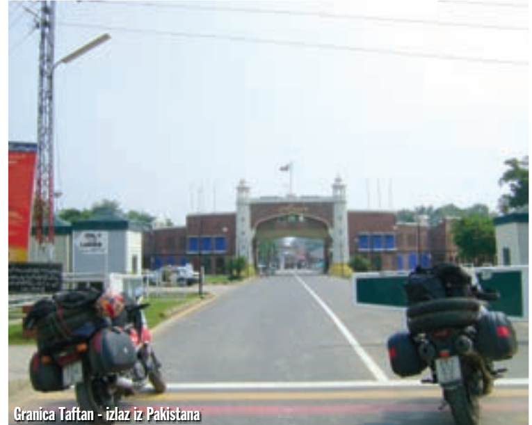
Granica Taftan - izlaz iz Pakistana

Dan smo završili u gradu Ludhiana. Našli smo hotel s dobrim restoranom