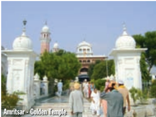
Amritsar - Golden Temple