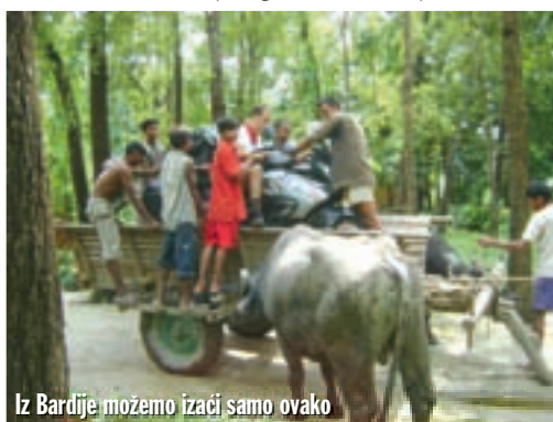
Iz Bardije možemo izaći samo ovako

se popodne pokušamo izvuci. Pregledavamo teren. Sve bi donekle išlo osim komada nekadašnje ceste koji je pod blatom. Krenuo sam bos baš u to blato, ali sam već nakon nekoliko metara zagazio do koljena. Tu neće moći proći bar još nekoliko dana, a drugog puta nema. S jedne strane puta je rijeka,