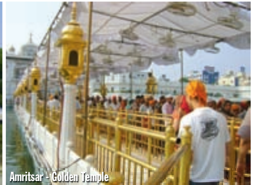
Amritsar - Golden Temple

sve. Promijenili smo eure u indijske rupije (1 euro = 60 rupija), te krenuli prema izlaznoj rampi. Obje strane granice impozantno su uređene, s izlazno/ulaznim prolazima te tribinama za priredbe - o tim priredbama napisati ću više u dijelu u kojem opisujem naš povratak. Do Amritsara je 30 kilometara, sada ću ispraviti ono što sam propustio prije godinu dana - posjetit ćemo jednu od najvećih atrakcija Indije. Ulazimo u grad u potrazi za svetištem Golden Temple. Kroz kaotični promet probijali smo se tako da smo bezbroj puta koferima taknuli mope, rikše, automobile... Udarali su me odostraga, savinuli mi tablicu, ali uspjeli smo naći to veliko hinduističko svetište. Isplatilo se potražiti ga. Dobili smo narančaste marame za glave, a prije nego smo smjeli ući, morali smo skinuti obu-