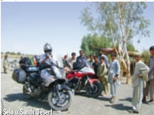
Selo u Sandy Desert

la prepuna terorista. U Ubauru više od sat vremena čekamo na smjenu pratnje. Čekali smo da se neka velika faca koja će nas voditi dalje okupa u rijeci i dotjera. Obukao je sniježnobijelu odoru i žutu kapicu. Onda je postrojio svoje podređene, a oni su tražili greške na njemu. Jedan mu je škarama morao popravljati brkove, a drugi dlake u nosu. Onda je uslijedilo slikanje s nama. Htio me zagrliti onako prljavog i znojnog. I konačno je došlo vrijeme za pokret. Sjeo je u civilnu, bijelu Toyotu, besprijeekorno čistu, baš kao i on sam. Odveo nas je nekoliko kilometara dalje i predao nas drugima, policajcima s teškim naoružanjem, kakvi su nas najčešće vodili. Prenočište smo našli u solidnom hotelu u gradu Rahimyar Khan. Obzirom kako grad izgleda (kao da ga je voda donijela, prljav, neuredan i kaotičan, prašnjavih ulica), ne bih nikada pomislio da ovdje može postojati hotel kao ovaj u koji su nas