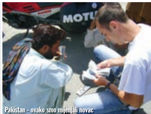
Pakistan - ovako smo mijenjali novac

60 pakistanskih rupija. Isto toliko stoji litra goriva. Pratnju nam nitko nije spomenuo. Slobodni smo krenuli pakistanskim Baluchistanom. U Iranu se piše Balučistan, sa č, a ovdje Baluchistan. Sve je to isto kao i prošle godine: nesnosna vrućina, kontrolne kućice u kojima se moramo upisivati, dine koje prelaze cestu, kupovanje benzina iz kanistera... Nova, odlična cesta već je odavno trebala završiti i pretvoriti se u kaldrmu. No, u godini dana, koliko me nije bilo, izgrađeno je novih 200 kilometara ceste. Stotinu kilometara prije grada Dalbandina tada smo se jedva probijali, a sada jurimo 160 km/h. U grad smo došli skoro dva sata prije sumraka, ali nismo htjeli ići dalje. Poučen iskustvom od prošle godine, znao sam da tako skoro nećemo naići na hotel, pa smo odlučili ostati. Inače bismo sigurno morali spavati vani, a to baš i nije poželjno. Hotel i jelo platili smo smiješno malo, ali pivo, koje nam je recepcioner naba-