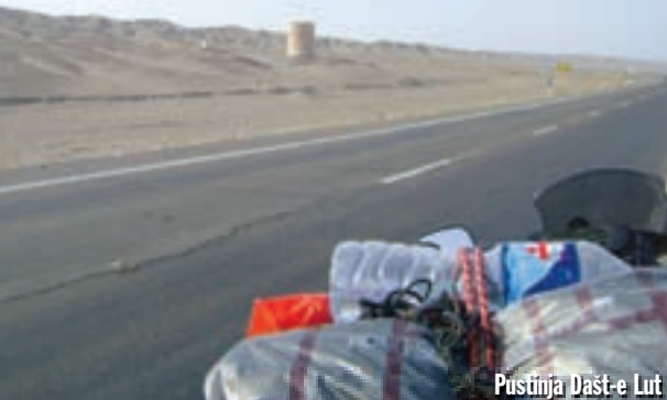
Pustinja Dašt-e Lut