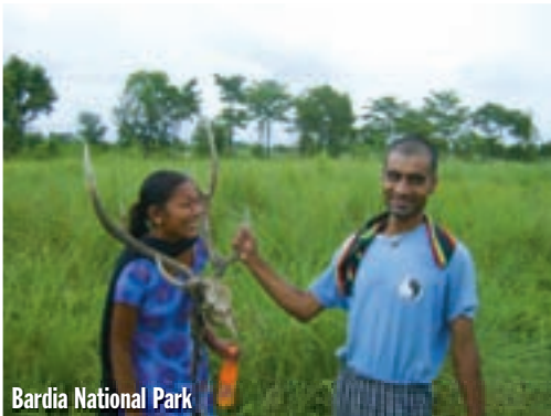
Bardia National Park