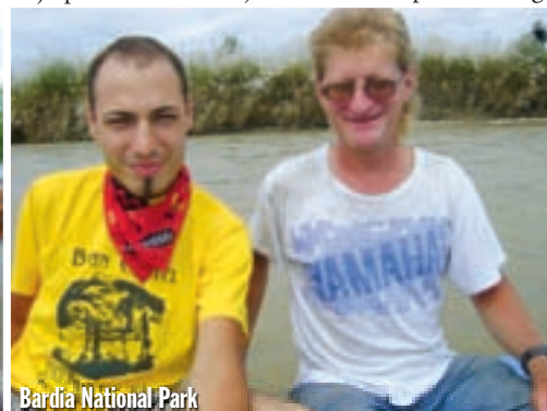
Bardia National Park