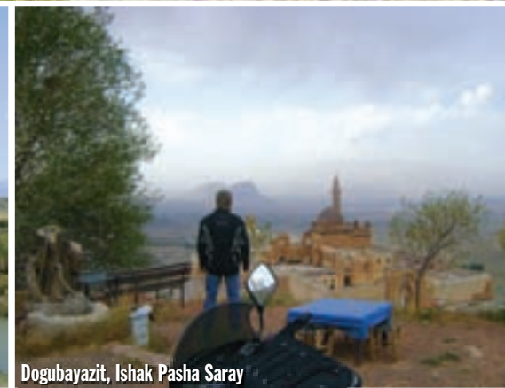
Dogubayazit, Ishak Pasha Saray