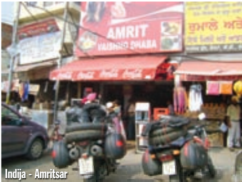
Indija - Amritsar