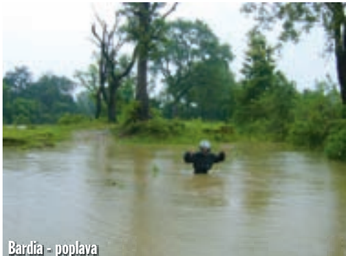
Bardia - poplava