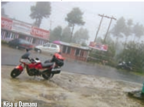
Kiša u Damanu