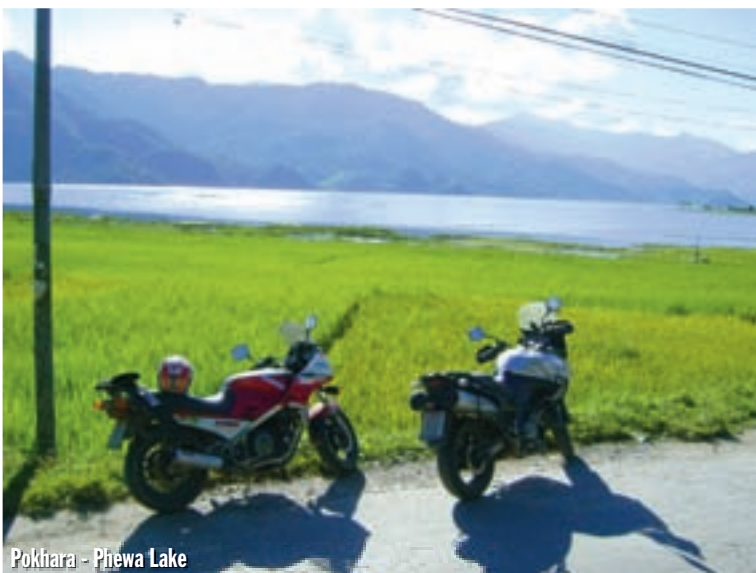
Pokhara - Phewa Lake