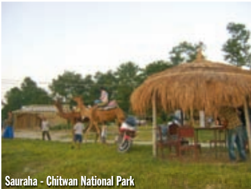
Sauraha - Chitwan National Park