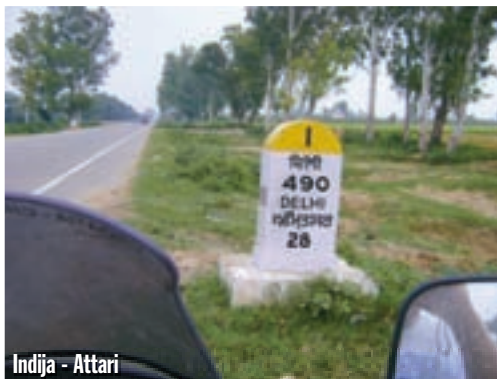
Indija - Attari

pali smo se granice i hotela u graničnom dvorištu. Poznajem ga od prošle godine. Simpatičan starac sa bijelom bradom više ne radi ovdje, ali kuhar i konobar ostali su isti. Svejedno nam je bilo ovdje dobro. Granica se ujutro otvara tek nakon 10 sati. Deset dana trebalo nam je do pakistansko-indijske granice, a to je 7.515 kilometara. Jutro koristimo za pregled motora. Ništa bitno nije potrebno: ulje je na nivou, do ovdje sam ga usput nalio samo četvrt litre. Suzukiju nije bilo potrebno niti toliko. Podesili smo i podmazali lance, prokontro-lirali vijke, a ja sam na Yamahi promijenio stop-žarulje. To je bilo