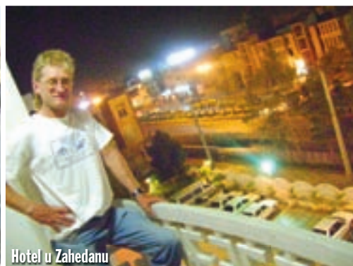
Hotel u Zahedanu

jezda na nebu. Nazdravili smo gutljajem prošvercanog Jackija, te legli.