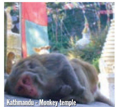
Kathmandu - Monkey temple