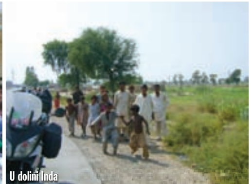
U dolini Inda

odveli. Vani je policajac s automatom ostao čuvati motore, ali i pripaziti da mi slučajno ne bismo izašli iz hotela. Stigli su i novinari, jedva smo se u miru otuširali. A bili smo stvarno prljavi!