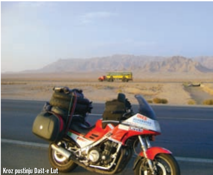
Kroz pustinju Dašt-e Lut