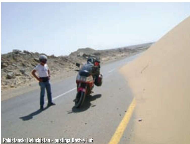
Pakistanski Belučistan - pustinja Dašt-e Lut