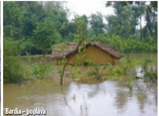
Bardia - poplava