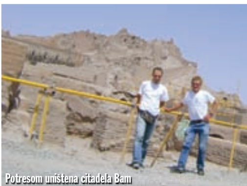
Potresom uništena citadela Bam