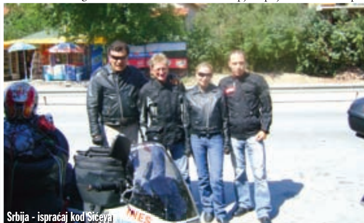
Srbija - ispraćaj kod Sićeva

vjernim putopiscima DUNLOP ® poklanja par guma