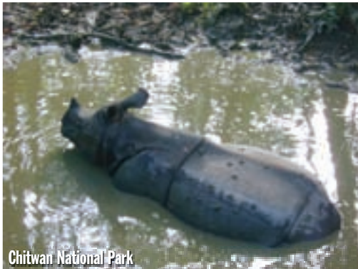
Chitwan National Park